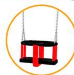
siedzisko typu kubetek

*wg cennika producenta FIGLER Place Zabaw/Projektowanie/Produkcja/Montaż www.figler.pl