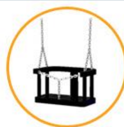
siedzisko z oparciem